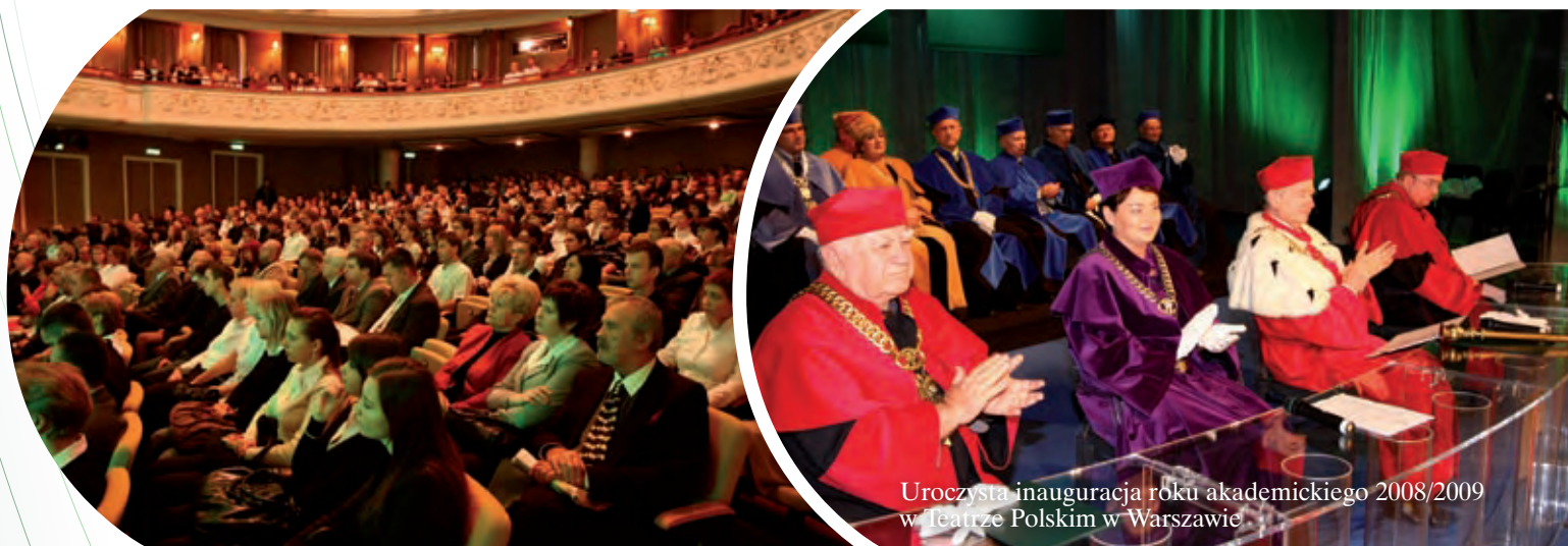
Uroczysta inauguracja roku akademickiego 2008/2009 w Teatrze Polskim w Warszawie