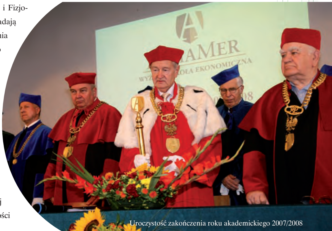
Uroczystość zakończenia roku akademickiego 2007/2008

Mam przekonanie, że dobrze wykorzystaliśmy minione 15 lat. ALMAMER tworzą dziś wydziały: Ekonomiczny, Turystyki i Rekreacji, Politologii i Fizjoterapii. Pierwsze trzy posiadają uprawnienia do prowadzenia studiów pierwszego i drugiego stopnia. Wydział Fizjoterapii wkrótce będzie mógł wystąpić o przyznanie uprawnień do prowadzenia studiów drugiego stopnia. Mam nadzieję, że w nieodległej przyszłości staniemy się Uczelnią, która będzie mogła nadawać stopnie doktorskie. Byłoby to istotnym podsumowaniem rozpoczętej przez nas 15 lat temu działalności dydaktyczno-naukowej.