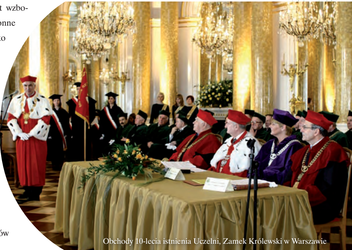
Obchody 10-lecia istnienia Uczelni, Zamek Królewski w Warszawie

Miarą pozycji ALMAMER na rynku edukacyjnym jest poziom prowadzonych badań naukowych oraz jakość wiedzy absolwentów i ich praktyczne umiejętności, w tym zdolność rozwiązywania problemów i podejmowania ryzyka.