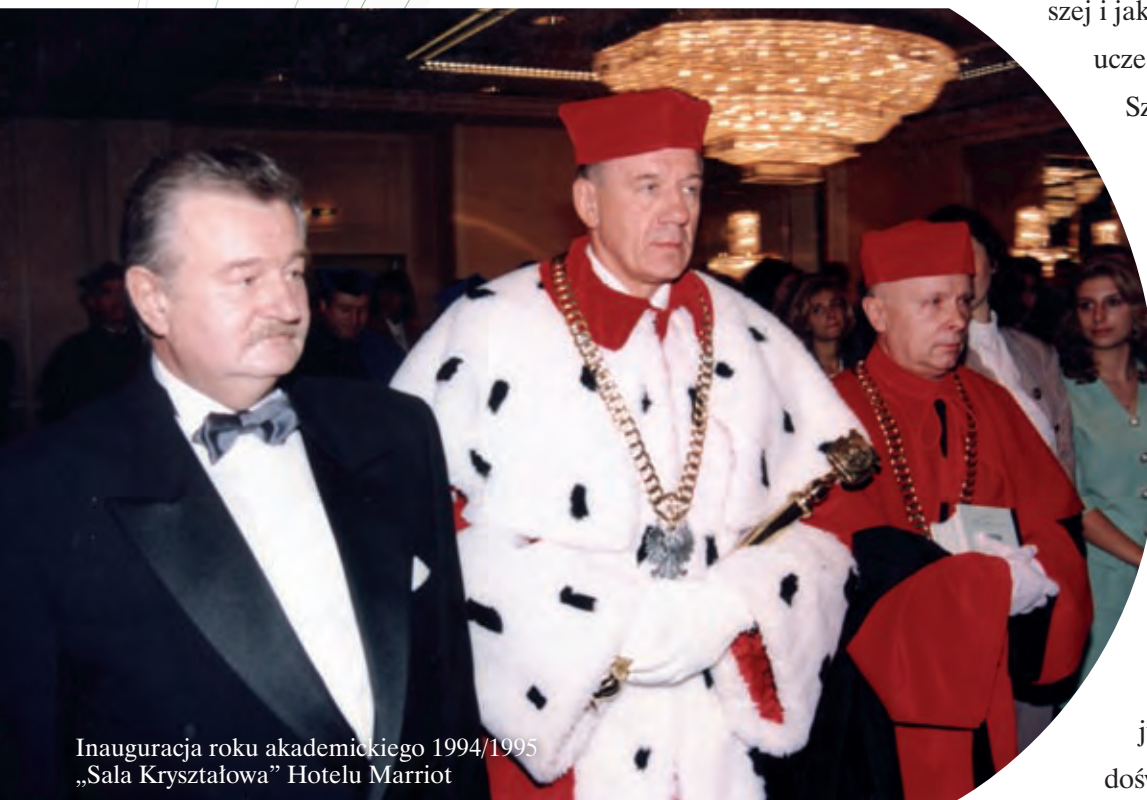
Inauguracja roku akademickiego 1994/1995 „Sala Kryształowa” Hotelu Marriot

szej i jakie były jej początki. Pierwotnie uczelnia miała nosić nazwę Wyższej Szkoły Gospodarki Rynkowej; w trakcie procedury związanej z tworzeniem szkoły zdecydowaliśmy jednak o przyjęciu nazwy Wyższej Szkoły Ekonomicznej w Warszawie, która w 2006 roku stała się dzisiejszą ALMAMER Wyższą Szkołą Ekonomiczną.