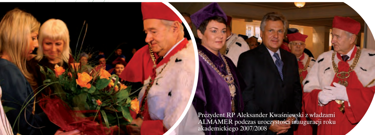
Prezydent RP Aleksander Kwaśniewski z władzami ALMAMER podczas uroczystości inauguracji roku akademickiego 2007/2008